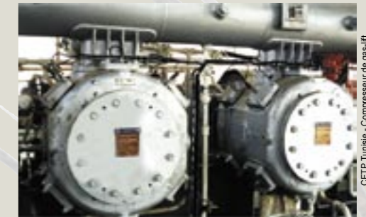
CFTP Tunisie - Compresseur de gas-lift

Pour les zones dangereuses, des capteurs certifiés EEx IIC ia T5 sont disponibles. Ils sont associés à des barrières Zener spécifiques situées, comme l'électronique, en zone sûre, ou dans un coffret ADF.