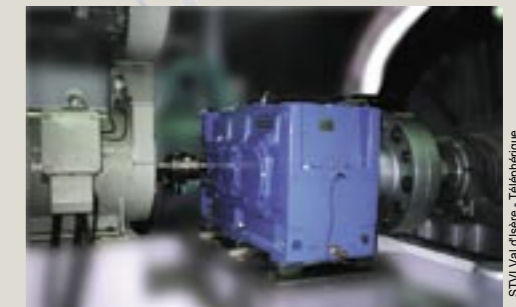
STV Val d'Isère - Téléphérique