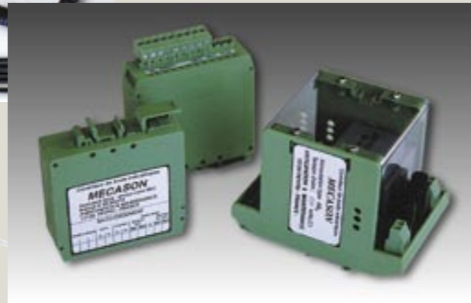
Mono-voie et alimentation

L'expérience acquise depuis 1991 montre que 90% des interventions concernent la lubrification (compléments d'huile, appoint de graisse, pollution du lubrifiant,...). En intervenant rapidement, vous rétablissez les conditions optimales et prolongez ainsi la durée de vie de vos mécanismes.